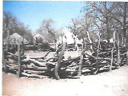
TSHANGA RA TIHOMU