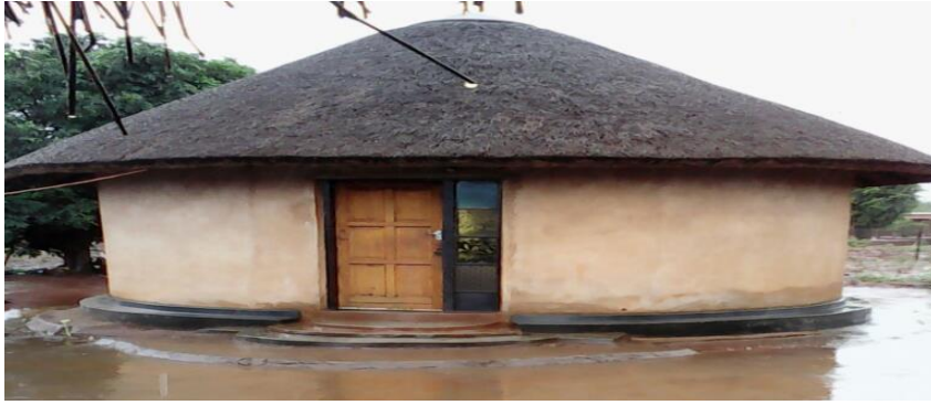
Rhandavula ya deke