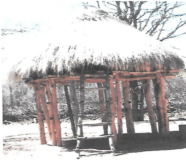
XIHAHLU XA TIHUKU