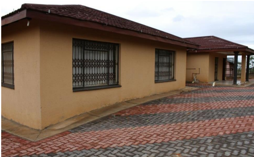
Yindlu ya tikamara to hambana-hambana