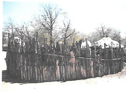
TSHANGA RA TIMBUTI