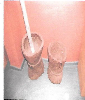
TSHURI NA MUSI